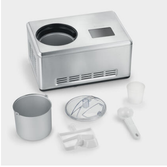
Inklusive Eisportionierer und Messbecher.